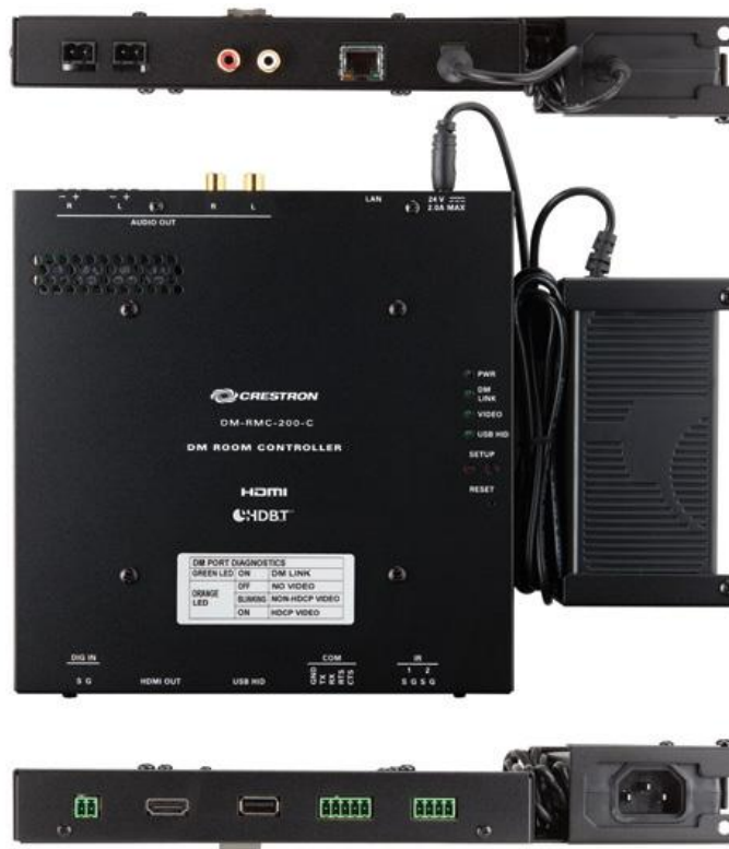
DM-RMC-200-C – Вид сзади, сверху, спереди и снизу