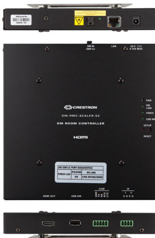
DM-RMC-SCALER-S2 – Вид сзади, сверху, спереди и снизу