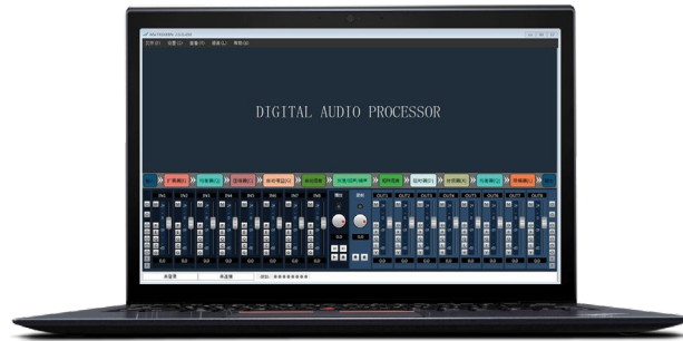
Клиентское программное обеспечение для платформы Windows