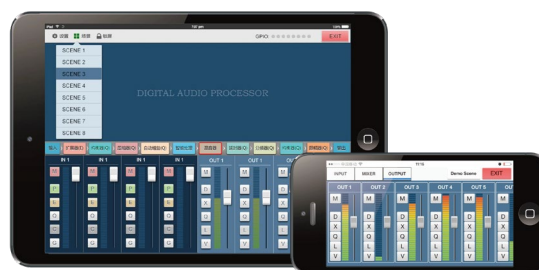
Программное обеспечение для управления платформой IOS