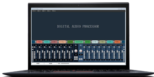
Клиентское программное обеспечение для платформы Windows