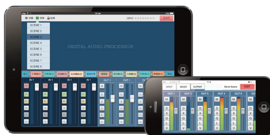
Программное обеспечение для управления платформой IOS