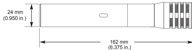
OVERALL DIMENSIONS - DIMENSIONS HORS TOUT

GESAMTABMESSUNGEN - DIMENSIONES TOTALES - DIMENSIONI TOTALI - 寸法