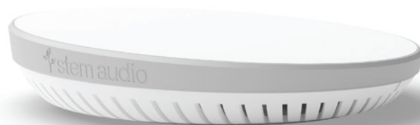
STEM HUB Коммуникационный центр